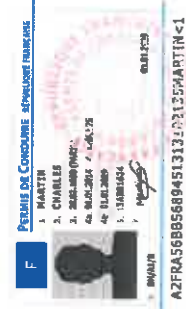
Permis de conduire