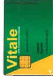
Carte vitale 1