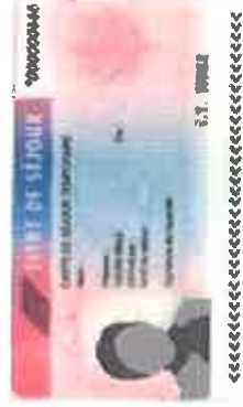
Un titre de séjour / carte de résident