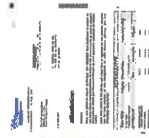
attestation d'ouverture de droits