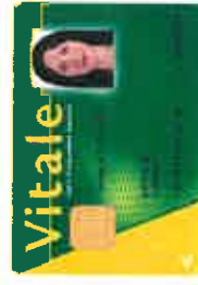
carte vitale 2